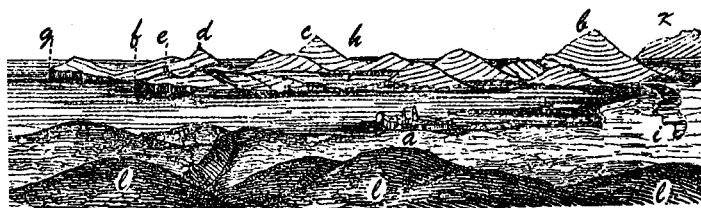
17. Dintorni di Alghero

Il Terziario manca del tutto nel territorio di Alghero; si comincia a riscontrarlo vicino alla cantoniera di Scala Cavallo, da dove partono le due diramazioni della strada nazionale, una per Sassari e l'altra per Torralba. Per contro c'è un deposito di arenaria quaternaria considerevole e molto istruttivo. Ecco una veduta geologica generale dei monti di Alghero: